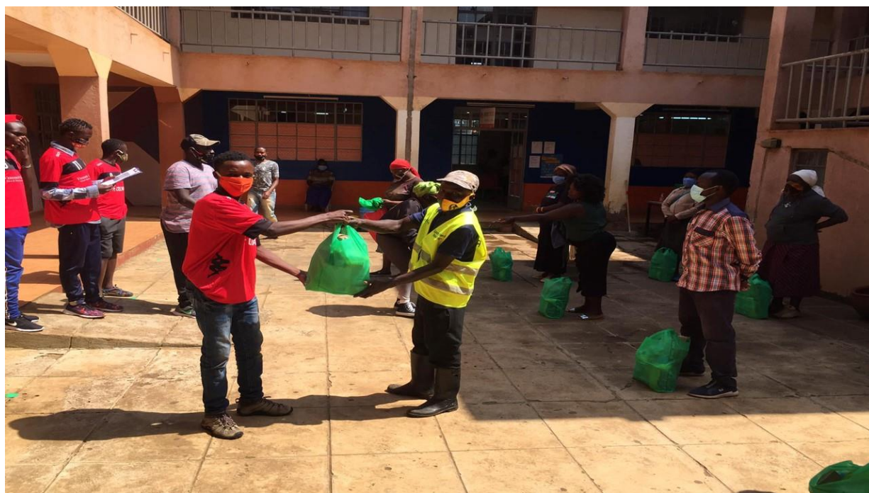
(A-GOAL プロジェクトの現地での支援の様子)

今後も、日本国内における本プロジェクトの活動の周知などを通じ、プロジェクト推進とアフリカ支援に協力してまいります。